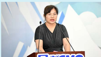
优秀毕业生家长代表发言

学院为2023届毕业生精心准备了专属毕业礼——以学院标志性风景和建筑物照片为内容制作的冰箱贴，愿那些为梦想拼尽全力的校园回忆，始终在学子们记忆深处熠熠生辉。