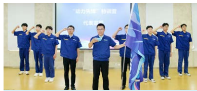
“动力先锋”特训营代表宣誓