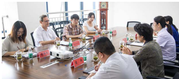
费舍尔先生与学院领导进行交流