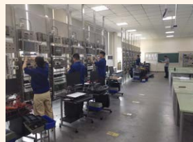
考核中，细致认真，争分夺秒