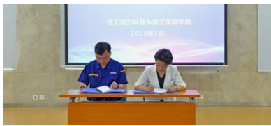
徐工动力科技与徐工技师学院 签订战略合作协议