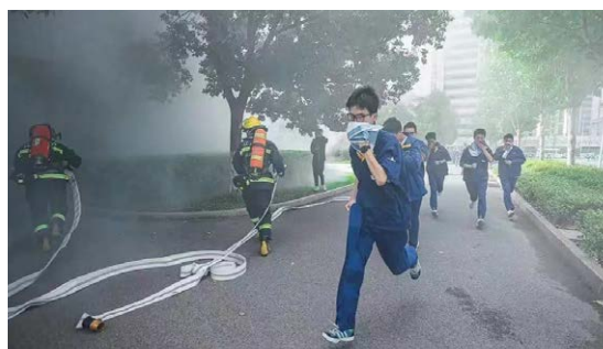
火灾演习现场，学生们有序安全撤离现场

本次活动组织学院400名左右师生参与，旨在普及应急知识和急救技能，树牢安全发展理念，营造“人人讲安全、个个会应急”的浓厚氛围。当天9时，一场形式生动的“应急演练课”在学院的操场上正式开讲。在消防疏散逃生演练现场，随着警报声响起，滚滚浓烟从学生宿舍楼不断涌出，“请迅速撤离到学院运动场，到指定位置集合，务必听从指挥，不要惊慌。”学生们纷纷按照引导，弯下腰、捂住口鼻、压低身体有序撤离到学校操场，现场大家全身心投入，积极协调配合。