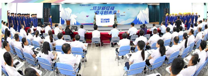
毕业生、在校学生宣誓

铮铮誓言，掷地有声，薪火相传，接力前行。毕业生、在校学生代表豪情满怀，带着期许与祝福，许下做徐工红色基因传承者和光荣传统践行者的郑重承诺。