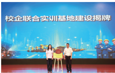
校企联合实训基地建设揭牌