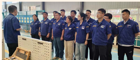
考核前，明确考试任务和要求