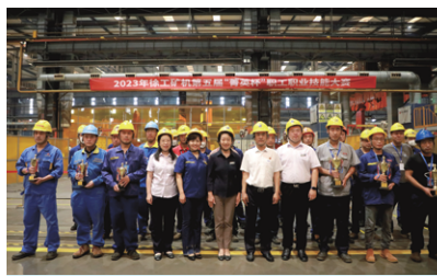
参会代表为竞赛获奖选手颁奖