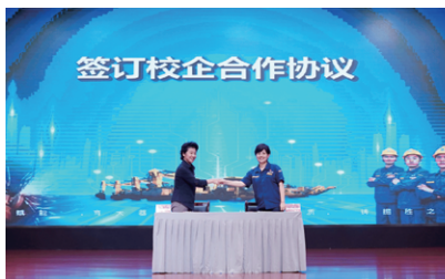
签订校企合作协议